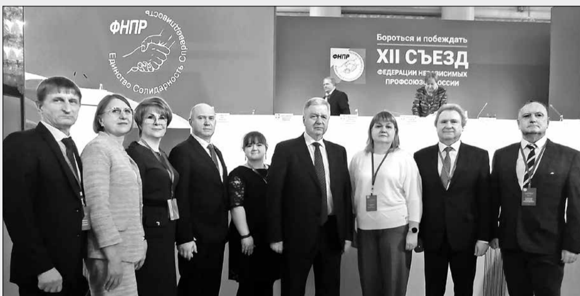
седателя ФНПР Михаила Викторовича Шмакова».

«Съезд - это всегда подведение итогов и определение задач на перспективу. Так было и в этот раз. Большое впечатление и надежду на дальнейшие позитивные изменения и развитие института социального партнерства оставили выступления Президента РФ Владимира Владимировича Путина и пред-