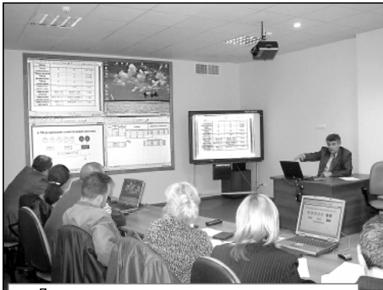
Программа дополнительных мер по снижению напряженности на рынке труда Омской области среди прочего предусматривает обучение, переобучение и повышение квалификации кадров.

О практике работы профсоюзных организаций совместно с органами власти и работодателями по содействию занятости и принятию мер по защите прав членов профсоюзов, высвобождаемых в результате сокращения численности и изменения режима работы, - так назывался основной вопрос заседания исполкома ФОП, состоявшегося 2 июня.