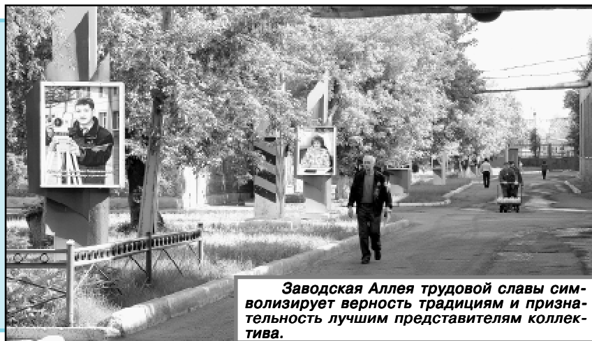
Заводская Аллея трудовой славы символизирует верность традициям и признательность лучшим представителям коллектива.

В ЭТОМ МЕСЯЦЕ В ОАО "ОМСКШИНА" НАЧАЛИСЬ МАССОВЫЕ ВЫСВОБОЖДЕНИЯ РАБОТНИКОВ. ПЕРИОД СЕЙЧАС ОЧЕНЬ СЛОЖНЫЙ ДЛЯ КОЛЛЕКТИВА, РУКОВОДСТВА И ПРОФСОЮЗНОГО АКТИВА ПРЕДПРИЯТИЯ. ЕЖЕДНЕВНО В ПРОФКОМ ОБРАЩАЮТСЯ СО СВОИМИ ПРОБЛЕМАМИ ПО НЕСКОЛЬКУ ЧЕЛОВЕК - КАЖДОГО НУЖНО ВЫСЛУШАТЬ И ПО ВОЗМОЖНОСТИ ПОМОЧЬ. ОСОБАЯ ОТВЕТСТВЕННОСТЬ И ТЕРПЕНИЕ ТРЕБУЮТСЯ ОТ ПРЕДСТАВИТЕЛЕЙ ПРОФСОЮЗНОЙ СТОРОНЫ, ЧТОБЫ СМЯГЧИТЬ СОЦИАЛЬНОЕ НАПРЯЖЕНИЕ И ВСЕЛИТЬ В ЛЮДЕЙ НАДЕЖДУ НА ЛУЧШИЕ ВРЕМЕНА.