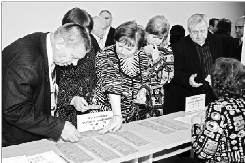
Идет регистрация делегатов конференции.

Вместе с тем областному комитету и профсоюзам надо активизировать работу с молодежью, привлекая ее к участию в подобном рода мероприятиях, искать для этого моральные и материальные стимулы. Молодые должны чувствовать поддержку и помощь профсоюза. Решать эту задачу, как и многие другие, названные мною выше, предстоит уже новому составу обкома профсоюза. Пожелаем, чтобы всё у него получилось.