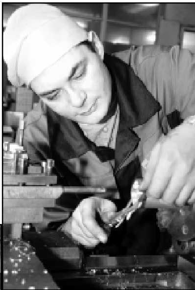
Для победы мало безупречно выполненного практического задания, необходимы и чисто теоретические знания.

Роль профсоюзной организации в этой ломке стереотипов трудно переоценить. Именно профсоюз помогает молодым рабочим встать на ноги, осознать себя полноправным членом большого трудового коллектива. И то, что защита интересов молодежи занимает такое заметное место в коллективном договоре, - тоже заслуга профкома. Как итог этих усилий - тот факт, что молодые сейчас приходят на завод с совершенно иными моральными установками, изначально уважая и