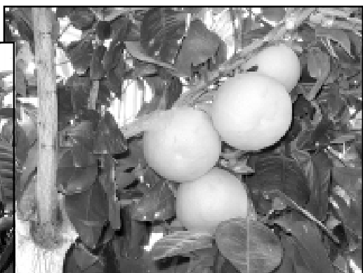
Грейпфрут. Его плоды растут не поодиночке, а гроздьями.

ром есть еще в документах персидского царя Дария I, главного противника Александра.