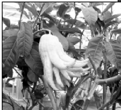
Цитрон сорта «рука Будды» - самый дорогой из всех цитрусовых.

БОЛЕЕ ТРЕТИ ВСЕХ СОБИРАЕМЫХ НА ЗЕМЛЕ ФРУКТОВ — ЦИТРУСОВЫЕ. В СВЯЗИ С ИХ СКЛОННОСТЬЮ К БЛИЗКОРОДСТВЕННЫМ СКРЕЩИВАНИЯМ «ОРАНЖЕВЫЙ КЛАН» ТАК РАЗРОСЯ, ЧТО РАЗОБРАТЬСЯ, КТО КОМУ КЕМ ПРИХОДИТСЯ, СОВСЕМ НЕПРОСТО.