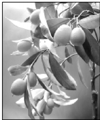
У кумквата - самого маленького из цитрусовых - съедобна не мякоть, а сладкая кожура.

БОЛЕЕ ТРЕТИ ВСЕХ СОБИРАЕМЫХ НА ЗЕМЛЕ ФРУКТОВ — ЦИТРУСОВЫЕ. В СВЯЗИ С ИХ СКЛОННОСТЬЮ К БЛИЗКОРОДСТВЕННЫМ СКРЕЩИВАНИЯМ «ОРАНЖЕВЫЙ КЛАН» ТАК РАЗРОСЯ, ЧТО РАЗОБРАТЬСЯ, КТО КОМУ КЕМ ПРИХОДИТСЯ, СОВСЕМ НЕПРОСТО.